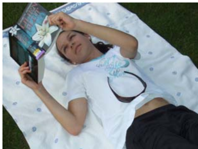
Verreisen per Buch

Die grosse Nachfrage zeigt, dass ein solches Ferienprogramm bislang gefehlt hat. Schüler/-innen, die durch den easy Lesesommer die Freude am Lesen entdecken, werden auch in Zukunft gern und aus eigenem Interesse zum Buch greifen. Damit ist für die Zukunft viel gewonnen, denn Lesen ist die Basisqualifikation schlechthin. Im besten Fall hält die Begeisterung für Geschichten und Bücher ein Leben lang an. Dann ist der easy Lesesommer 2010 nicht nur zahlenmässig ein Erfolg, sondern für den einen oder die andere auch ein guter Start in die Ausbildungs- und Berufswelt.