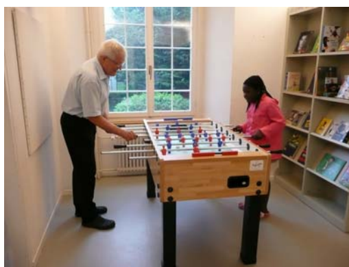
Fussball-WM in der Bibliothek

Ausleihstärkster Monat ist der März, gleich dahinter folgt der Januar mit fast ebenso vielen Ausleihen. Während der Sommerferien sind die Öffnungszeiten stark eingeschränkt, durch die grosse Nachfrage in der Badi-Bibliothek hat der früher schwache Juli gegenüber den anderen Monaten jedoch mächtig zugelegt. Die obige Aufstellung zeigt, dass übers ganze Jahr hinweg eine konstante Nutzung der Bibliothek zu verzeichnen ist. In den wärmeren Monaten liegen die Ausleihzahlen eine Spur tiefer als im Winterhalbjahr. Gut nachvollziehbar, ist doch das Angebot an Freizeitaktivitäten im Sommer ungleich grösser als im Winter. Und gibt es etwas Schöneres, als an einem grauen November-Sonntag mit einem spannenden Buch gemütlich auf dem Sofa zu verbringen?