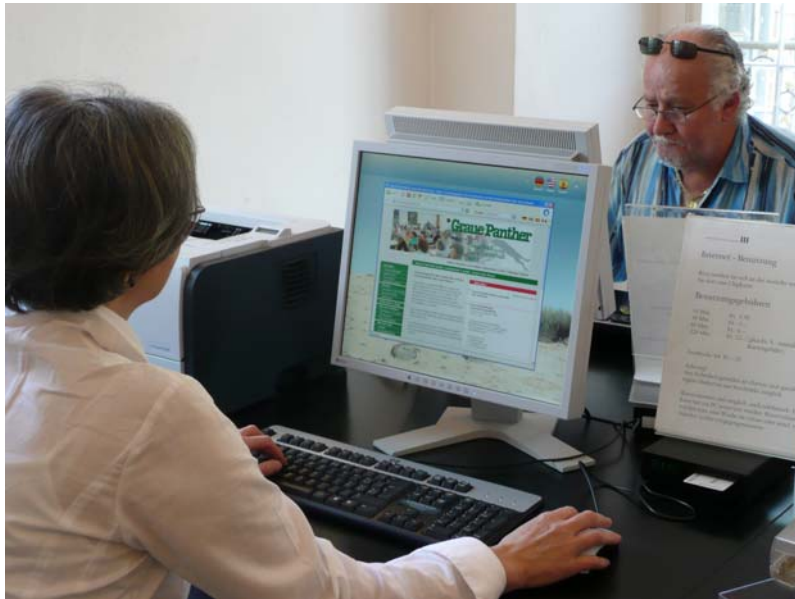
Recherchieren im Internet

Die beiden öffentlichen Internet-Stationen sind während insgesamt 1'171 Std. (2009: 1'225 Std.) belegt.