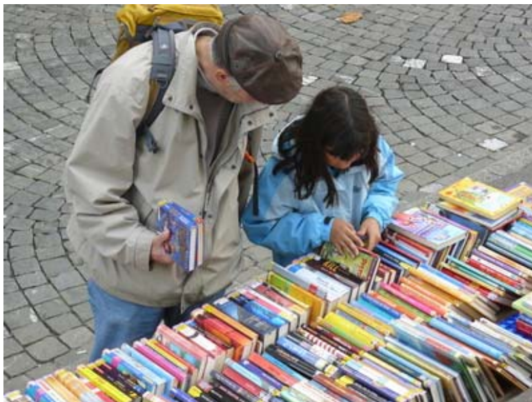
Bücherflohmarkt vor der Stadtbibliothek

Alle Zahlen zur Bestandesentwicklung s. Kapitel 9 Die Zahlen im Detail