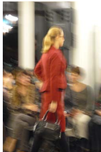
Modeschau in der Stadtbibliothek

Im September genehmigt der Stadtrat das PR-Konzept für die Stadtbibliothek , welches von einer Arbeitsgruppe erarbeitet wird.