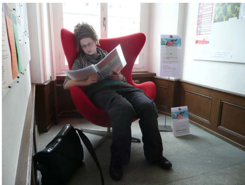
Welttag des Buches: Geschichten zum roten Sessel