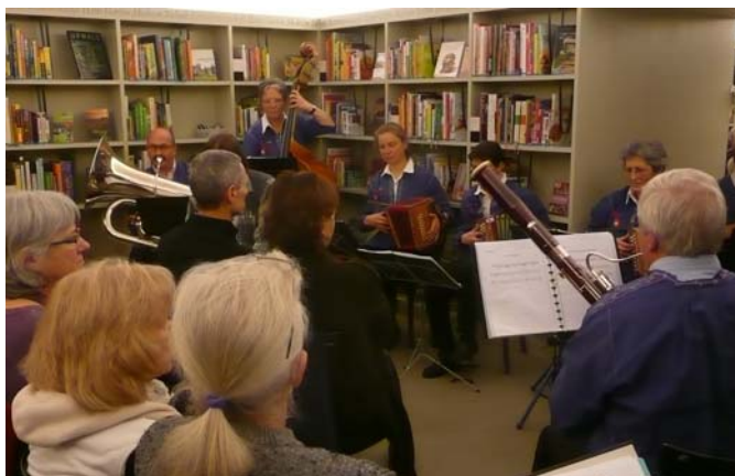
Die Aarau Schwyzerörgeli Fründe in ungewohnter Umgebung